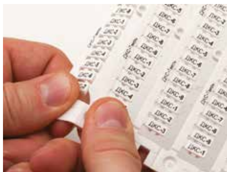
Отделить маркировочные элементы