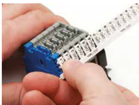
Возможна групповая маркировка клемм